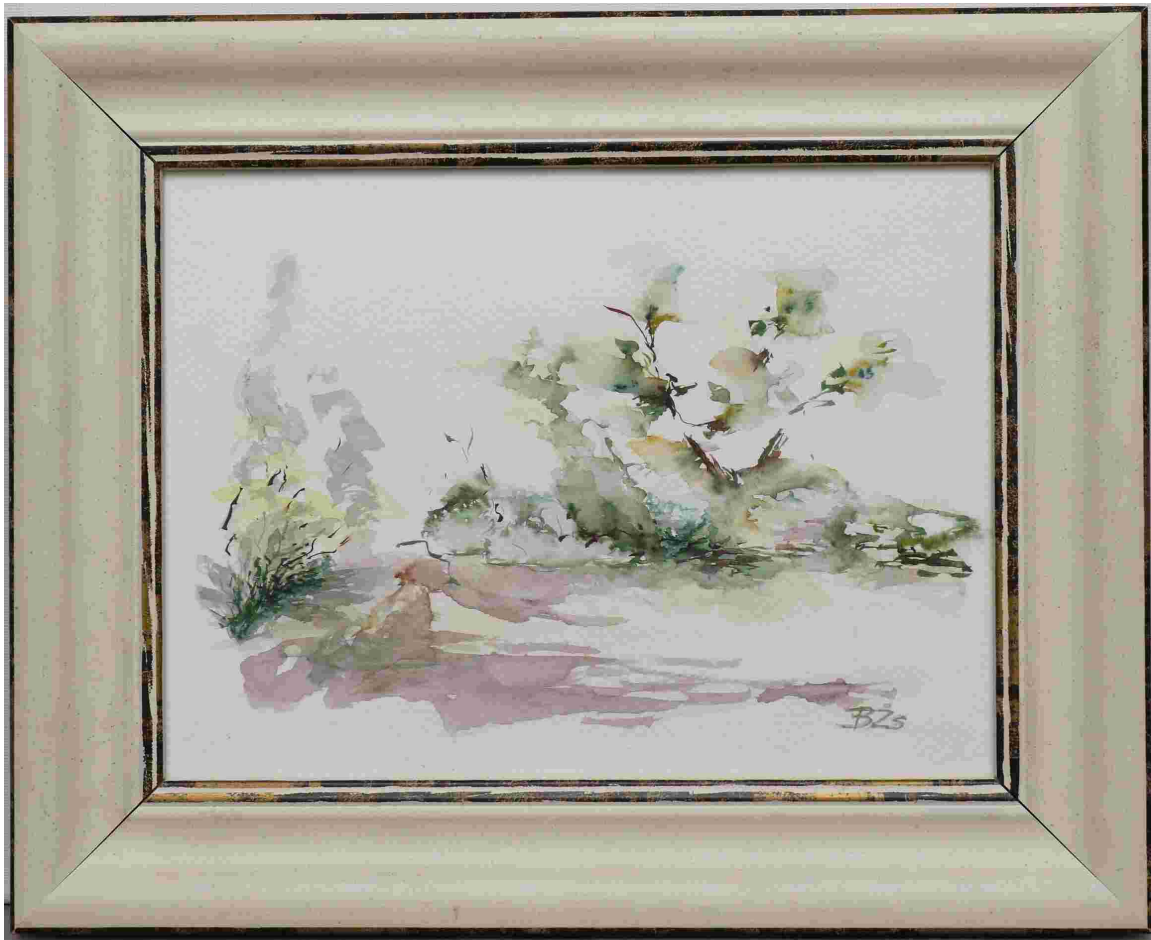
ÁRTÉR, aquarelle, papír, 18x24 cm, 2016