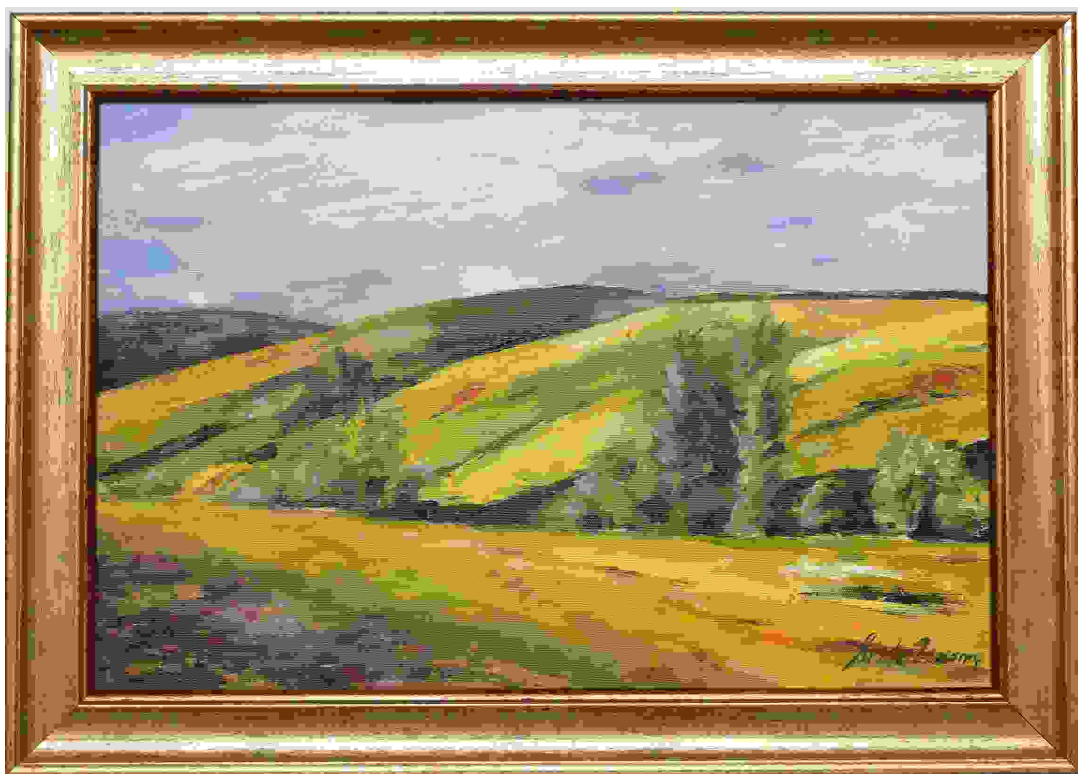
GÖMÖRI TÁJ, olaj, vászon, 40x60 cm, 2024