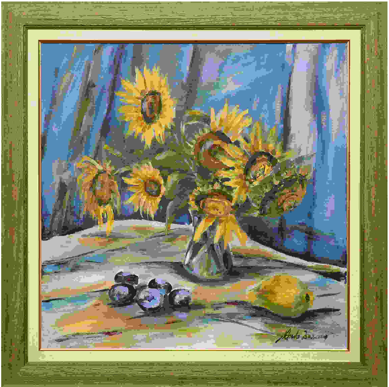
KÉKÍTŐ , akril, vászon, 60x60 cm, 2024