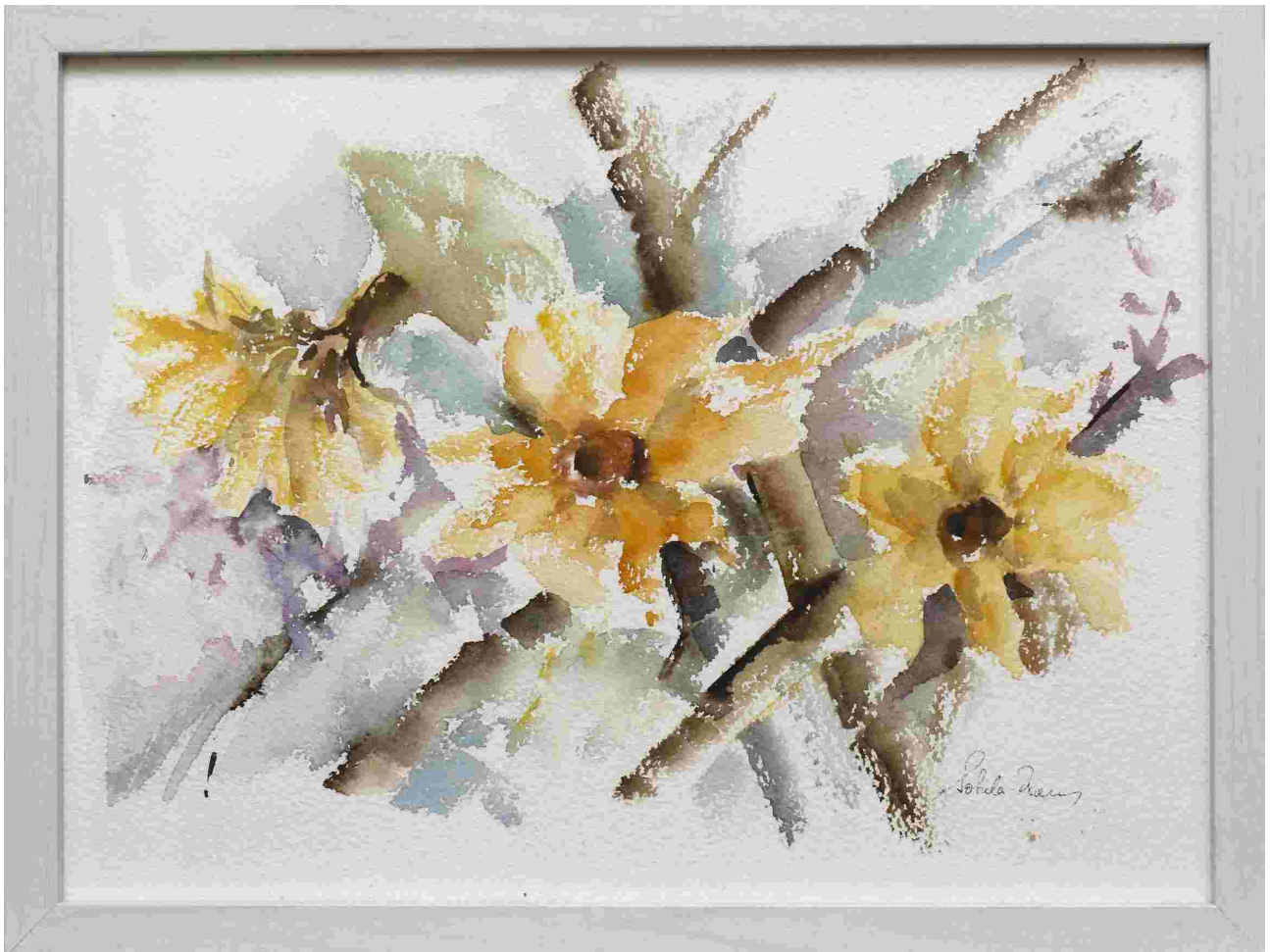
RÁCSON , aquarelle, papír, 30x40 cm, 2021