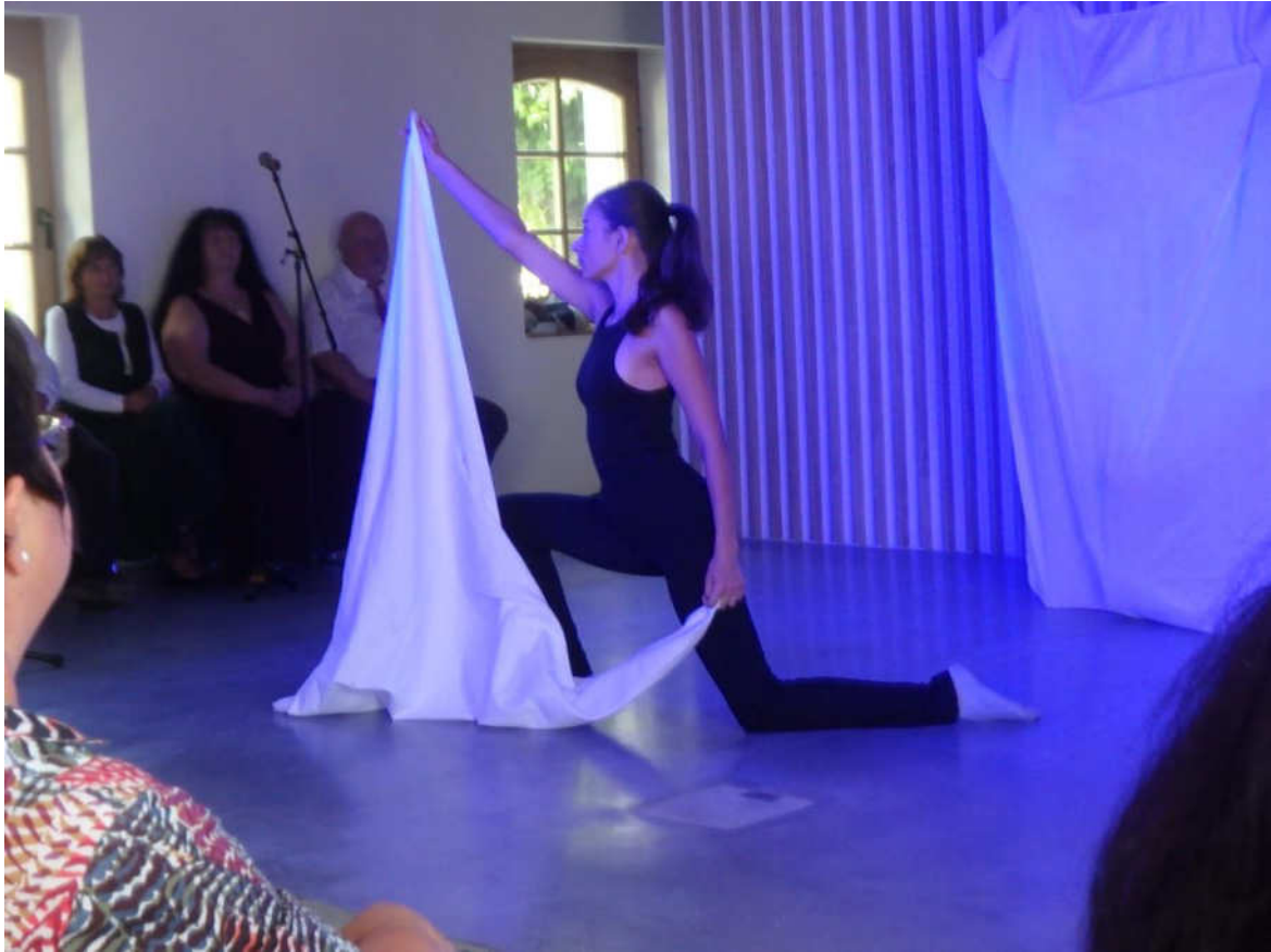
a Váci Drámakör előadása a Madách Imre bicentenáriumon; emlékezve a nagy költőre, aki a Váci Piarista Gimnáziumban tanult 1930-1937 között