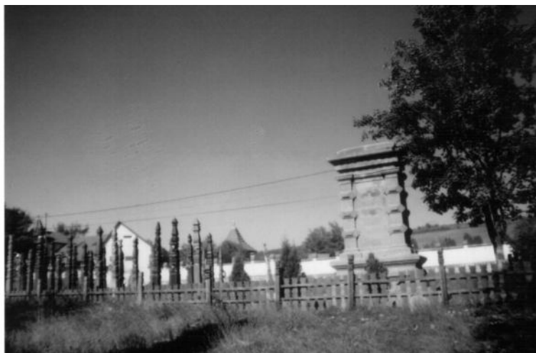
Gábor Áron síremléke a kopjafákkal – Eresztevényben

Eresztevényben (Segesvár és Kovászna között félúton) 1892-ben állították fel Gábor Áron emlékművét. Eresztevény, 400 kilométerre található a magyar határtól, tiszta magyar helység, magyar nyelvű iskolája is van. 2014-ben, az alulírott is csatlakozott, ezen emlékmű mellett felállított kopjafa-erdőhöz. Kezdetben csak néhány, majd mi minden alkalommal több kopjafát állítottunk. A mi jelenlétünk alkalmával, az összes addig felállított kopjafákat – a 4 magyar egyház (református, unitárius, evangélikus és római katolikus) egy-egy papja felszentelte. Napjainkban e kopjafaerdő mintegy 60 kopjafájából 15 kopjafát mi állítottunk.