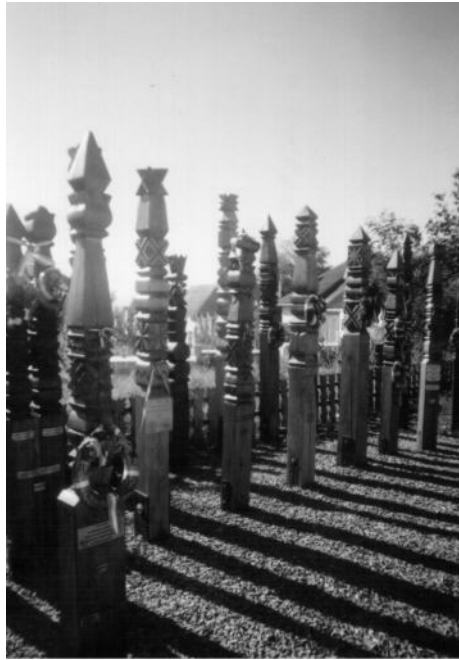
A síremlék a kopjafákkal – Eresztevényben

A továbbiakban egy elméleti kopjafarajzot mutatunk be, a tényleges kopjafák ezen elméleti felosztásnak nem mindenik vetületét tartalmazzák.