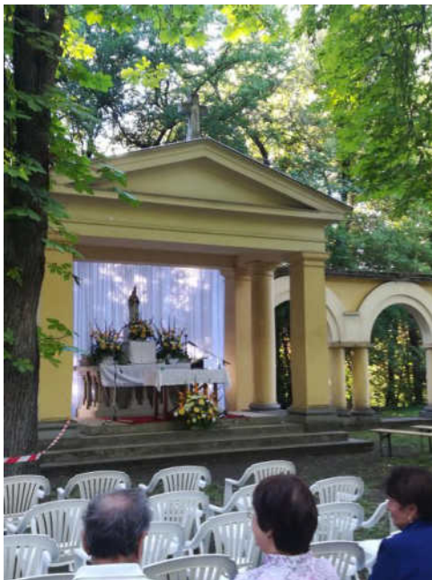
Szeptemberi Mária-Nagybúcsú és zarándoklat a Ligetben; a Kültéri oltár